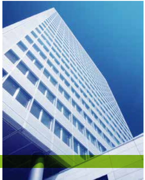
© 2011 Munich Re Königinstr. 107, 80802 München, opgericht in Duitsland